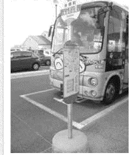
東郷町巡回バス停留所

名古屋記念病院 名古屋市営地下鉄鶴舞線「平針駅」から、南へ徒歩約5分。名鉄豊田線「日進駅」、「米野木駅」から乗車可。