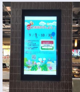
ららぽーと愛知東郷館内サイネージ

■令和4年9月及び10月の利用者数について、前年比9月（13,345人→14,635人）、10月（14,227人→15,338人）と増加。ららぽーと愛知東郷のホームページや館内サイネージへの掲載や日進市及び豊明市の広報誌にも掲載したことから、当該取組について市外の人からの問合せもあった。