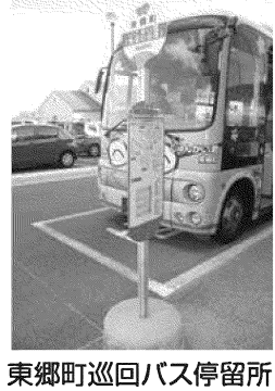
東郷町巡回バス停留所

名古屋記念病院 名古屋市営地下鉄鶴舞線「平針駅」から、南へ徒歩約5分。 名鉄豊田線「日進駅」、「米野木駅」から乗車可。