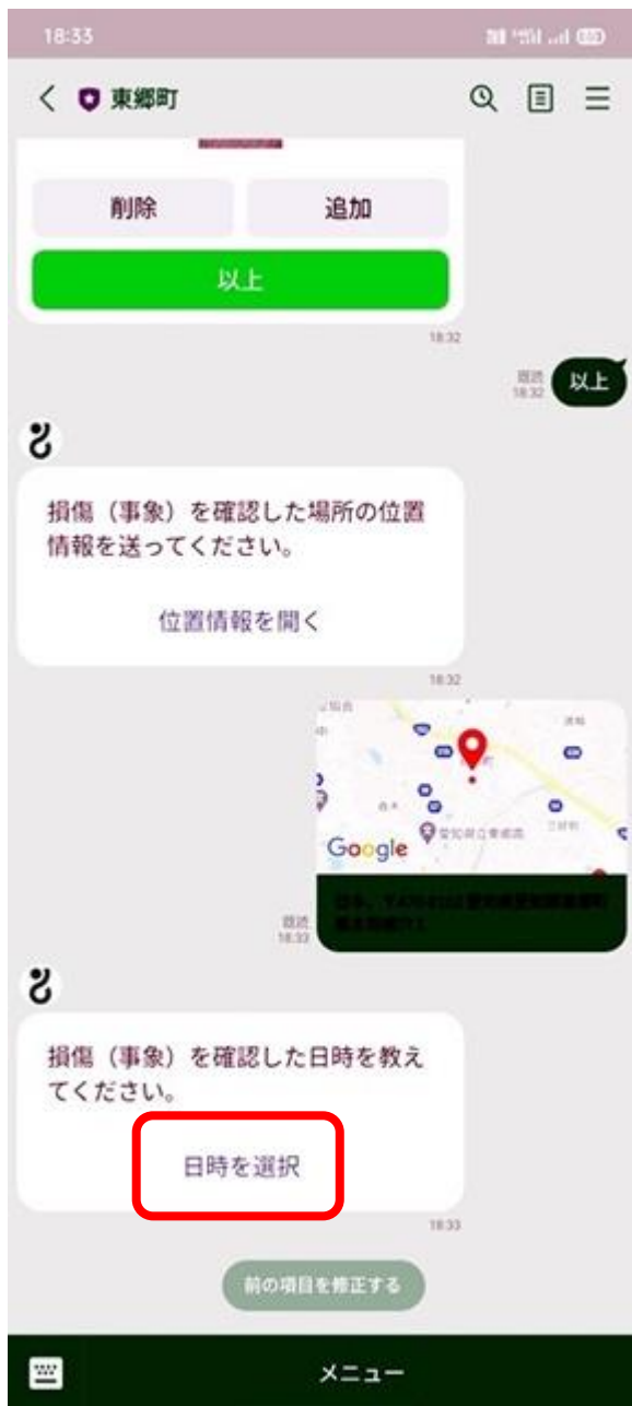
⑩ 「日時を選択」を押し、日時を指定します。 (機種によって操作が異なります)