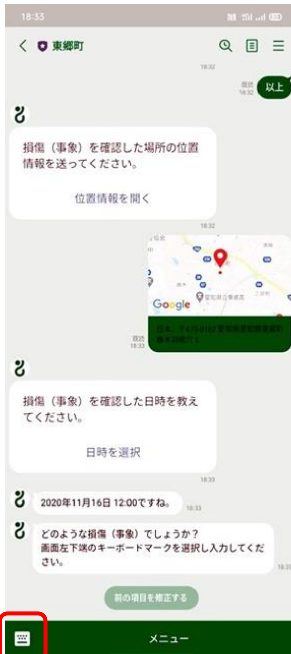
⑪ 状況入力のためメニュー左側のキーボードボタンを押します。