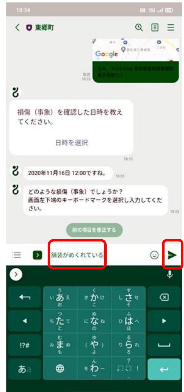
⑫ 状況を入力して、▶を押します。