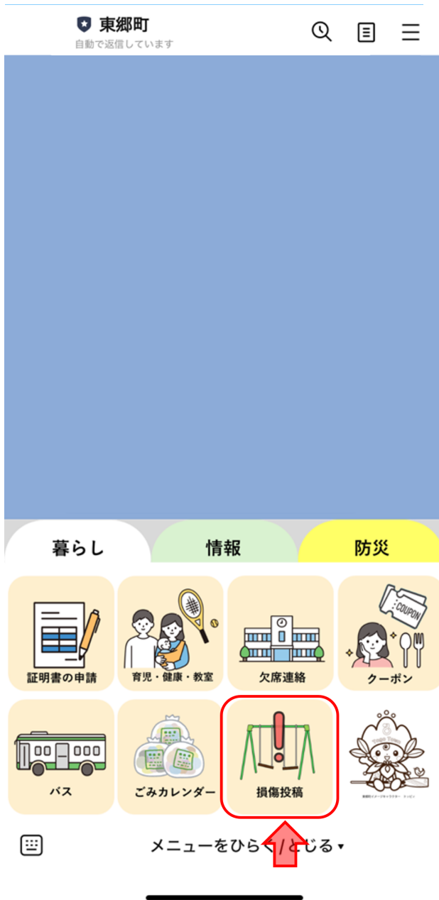
① 損傷投稿の枠内を選択